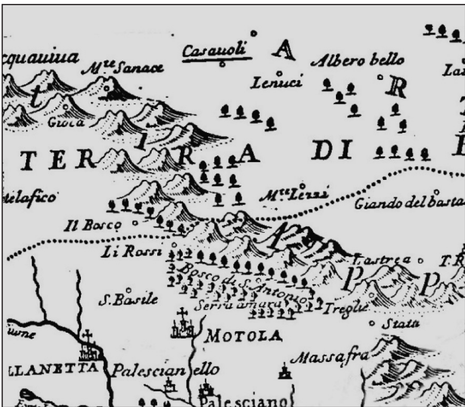
Mottola e San Basilio, detto San Basile, in una cartina compilata dal cartografo Domenico de Rossi nel 1714.

Quindi, in una lunga e piacevole narrazione, che occupa molte pagine del nominato diario, cita fiere e mercati importanti che si connettono con l'economia della borgata di San Basilio, tratta della lavorazione di lana e delle malattie di animali, analizza le tecniche di conduzione di pollai ed esalta i pranzi che gli hanno deliziato il palato.